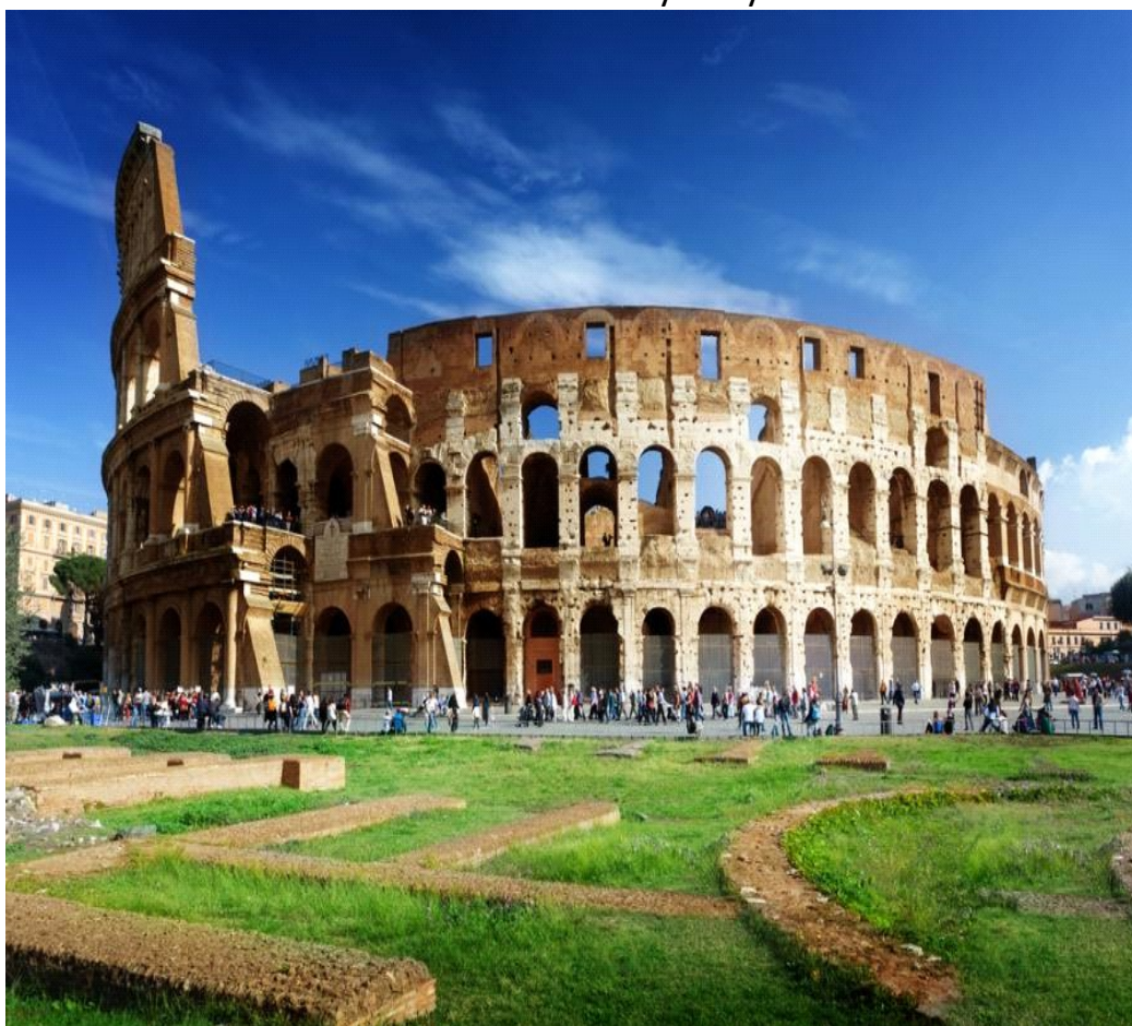
Koloseum - Włochy - Rzym

- Poznawanie ciekawostek o wybranych krajach europejskich. Oglądanie charakterystycznych dla nich budowli, symboli, np.: